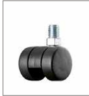
Kunststoff-Doppelrolle (2 cm höher)