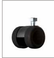
Parkettrolle (2 cm höher)